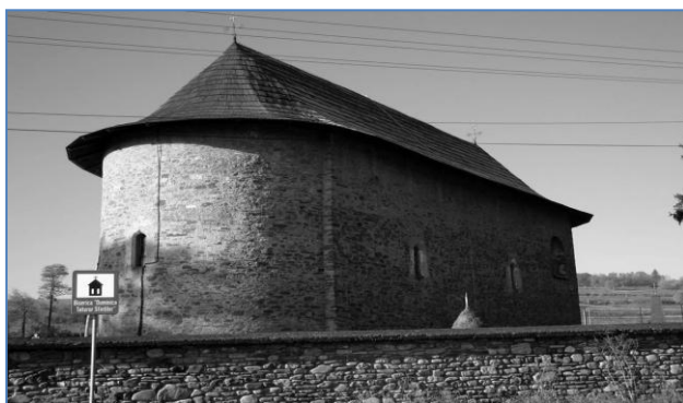
Biserica din Părhăuți văzută din N-V și din N-E