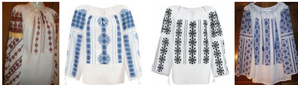
Figura 2: Modele de ii contemporane

În modelele actuale de ii, mâneca este formată dintr-un singur reper, aceasta fiind de croială raglan. Astfel, toate elementele de decor sunt efectuate pe același reper. În continuare sunt prezentate câteva modele de ii cu astfel de croiala (figura 2).