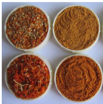
Fig. 1. Echantillons (a) de déchets de tomates secs, (b) de déchets de tomates broyés

On a déterminé que la composition des déchets de tomates séchées consiste de 62,29 % - graines, 35,69 % - peau et 2,02 % - chair et autres parties végétales.