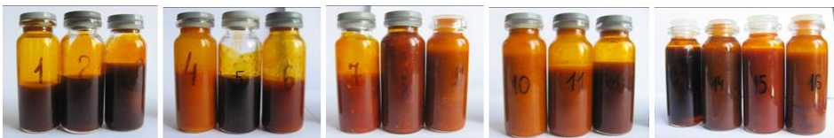
Fig. 3. Echantillons de CO 2 -extraits déchets de tomates obtenus à différents paramètres d'extraction

Conformément au régime d'extraction, la couleur des CO 2 -extraits lipophiles de déchets de tomates varie de rouge-orange à rouge brique.