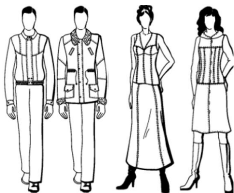
Figura 1. Produse vestimentare din piele pentru bărbați și femei

Proiectarea produselor de îmbrăcăminte din piei se realizează în corespondență cu proprietățile și particularitățile acestor categorii de materii prime, care influențează soluția constructivă a produselor vestimentare, sunt evidențiate următoarele: nu pot fi supuse tratamentelor umido – termice; structura acestora nu permite deplasarea sau modificarea liniilor constructive în procesul probelor, fiind impusă alegerea atentă a unor metode de proiectare și mijloace adecvate de modelare a formei spațiale a produselor de îmbrăcăminte; aria limitată a unei piei animale, impune utilizarea rațională a suprafeței pieii naturale, modelele de produse vestimentare se proiectează cu un număr mare de elemente constructive și repere [1, p.270]. Pentru produsele vestimentare din piele sunt caracteristice siluetele clasice, fiind considerate, siluete de bază la orice schimbare a tendințelor modei: drepte, semiajustate și trapez. De altfel, cel mai actual în această perioadă este silueta semiajustată, utilizată la proiectarea îmbrăcăminte atât pentru femei cât și pentru bărbați ( figura1).