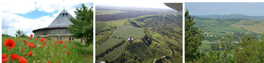
Cucuteni-Băiceni, locul culturii Cucuteni.

La circa 60 km nord-est de orașul Iași și la 9 km spre nord de Tg. Frumos se află satul Cucuteni, de care depindea în trecut, din punct de vedere administrativ, vestita stațiune neolitică de pe locul Cetățuia. Întrucât descoperirile mai vechi de pe Cetățuia sunt cunoscute în lumea întreagă ca fiind de la Cucuteni, s-a adoptat denumirea de Cucuteni-Băiceni și nu Băiceni, cu toate că așezările neolitice se află astăzi pe teritoriul localității din urmă.