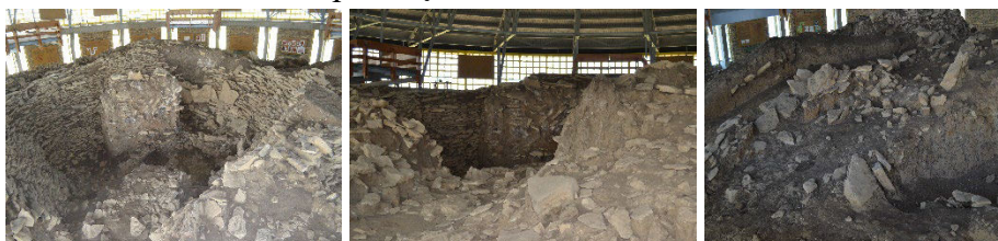
Complexul cultural Cucuteni, c. Cucuteni (2).

Vestigii arheologice de pe dealul din zona Cucuteni-Băiceni sunt în circuit UNESCO, dar nu îndeplinesc condițiile calitative de amenajare. Scopul investițiilor este de a le înscrie în acest circuit la nivelul de calitate cerut conform importanței acestora.