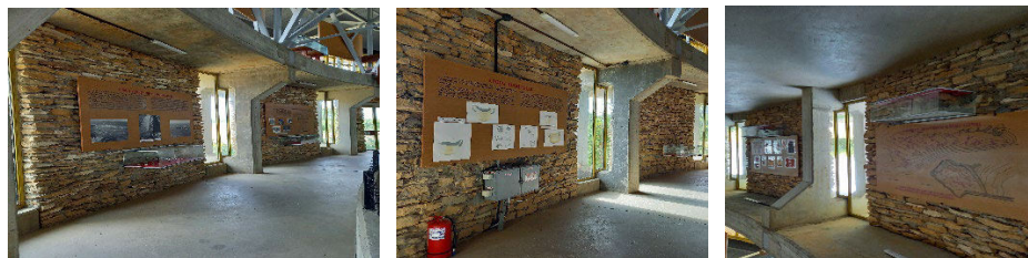
Complexul cultural Cucuteni, c. Cucuteni (3).

Împrejmuirea locului s-a propus prin amenajări peisagistice cu gard viu. Între punctele principale de interes s-au prevăzut alei sau scări de acces din piatră naturală. S-a prevăzut, de asemenea, reamenajarea aleii principale cu dale prefabricate, bănci, jardiniere și corpuri de iluminat. Întregul ansamblu este protejat de un gard de plasă de sârmă, h=1,20 m sau de un gard viu cu lățimea de 80 cm.