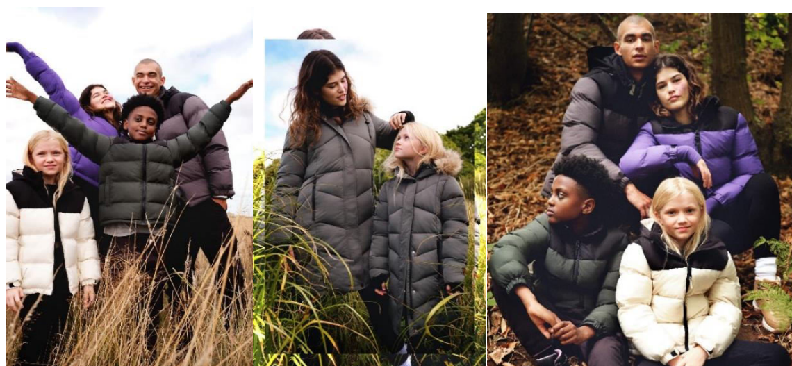
Figura 4. Scurte matlasate pentru întreaga familie [9]

În sezonul rece, îmbrăcăminte exterioră nu este doar o necesitate practică, ci și o modalitate de a exprima stilul personal. În ultimii ani conceptul „family look” care își are rădăcinile în Asia, câștigă popularitate în întreaga lume.