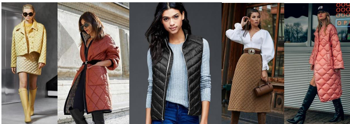
Figura 3. Îmbrăcăminte – tehnica Quilting [8]

În ultimii ani, matlasarea a cunoscut un nou val de popularitate, în special în rândul îmbrăcăminteii pentru familie. Îmbrăcăminte pentru adulți și copii devine tot mai popular și mai vizibil în lumea modei creând trendul „family look”.