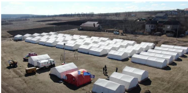
Figura 3. Locuințe temporare de pe teritoriul R.Moldova [5]

„În cele șase luni de la izbucnirea războiului, peste 65 de mii de persoane refugiate au fost cazate în cele 130 de centre de plasare temporară (fig. 2). Astăzi, în țară mai activează 74 de centre temporare de plasament, care găzduiesc peste 3000 de refugiați ucraineni. Alte șapte centre sunt în gestiunea Biroului Migrație și Azil cu o capacitate de două mii de locuri. Aici refugiații sunt cazați gratuit și au acces la toate serviciile necesare” [1].