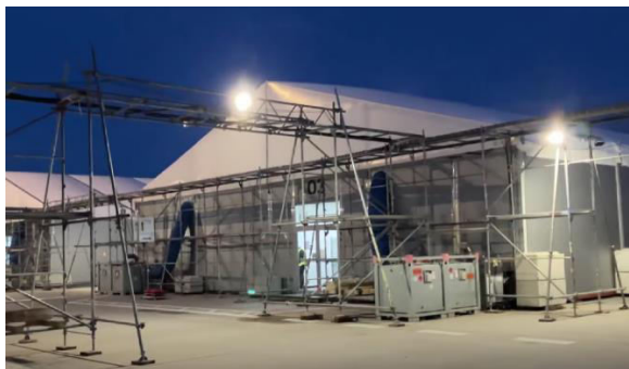
Figura 5. Locuință temporară în proces de construcție. Berlin [11]

Au fost depistate tabere pentru refugiați în regiunile Hermsdorf în Turingia, Merane în Saxonia, Bochum în Renania de Nord-Westfalia, Bramsche în Saxonia Inferioară, Freiburg, Messstetten și Karlsruhe în Baden-Württemberg, Tegel în Berlin (fig. 5) [7].