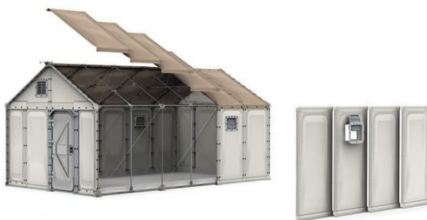
Figura 2. Structura locuinței temporare [3]