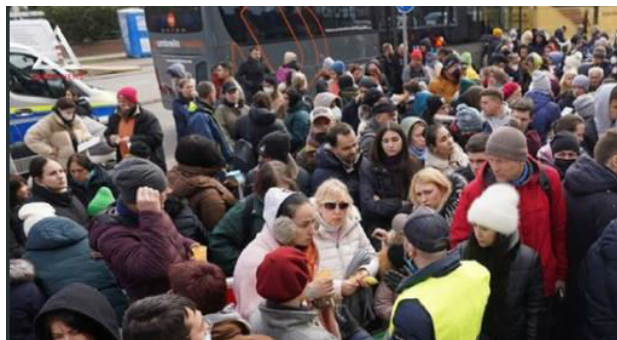
Figura 6. Mulțimea recent sosită în Germania [12]

În Republica Federală mai trăiesc și aproximativ un milion de refugiați de război din Ucraina - majoritatea a optat pentru cazare privată, dar nu întotdeauna această soluție a funcționat pe termen lung, așa că tot mai mulți ucraineni au cerut autorităților locuințe din fondul de stat. Astfel, au fost alocate peste 300 000 de locuințe individuale [10].