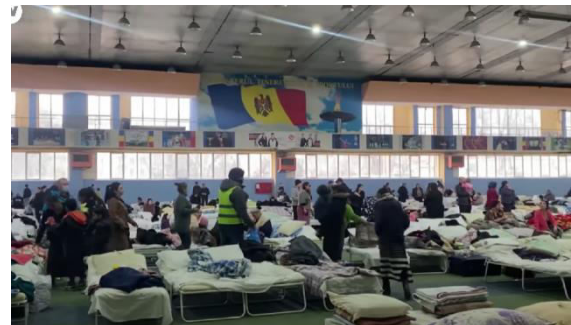
Figura 4. Organizarea spațiilor locative în una dintre instituțiile Ministerului Tineretului și Sportului [6]

„Conform datelor statistice privind beneficiarii refugiați din Ucraina servicii municipal 06.02.2023 15 949 de persoane refugiate au fost cazate/înregistrate în centrele de plasament municipale” [2].