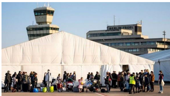
Figura 1. Refugiații în fața taberei

În ceea ce privește aspectele sociale, arhitectura de urgență trebuie să ofere și spații comune, cum ar fi locuri de joacă pentru copii, zone de întrajutorare și centre comunitare. Acestea pot promova reconstrucția socială și emoțională, prin furnizarea unui mediu care să faciliteze interacțiunea, comunicarea și solidaritatea între refugiați (fig. 1).