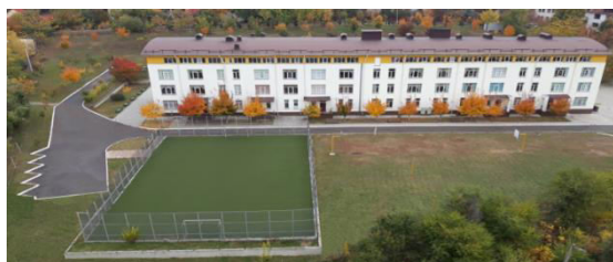
Figura 3. Instituția Publică, Complex Educațional "Ilie Fulga", or. Stăuceni

1. La nivel de experiență locală în mun. Chișinău în ultimii ani au apărut mai multe complexe educaționale care îmbină grădinița cu școala primară, acestea ele sunt situate în diferite sectoare a orașului și mai des sunt de tip privat, însă se regăsesc și instituții de stat ca "Ilie Fulga" din com. Stăuceni. Această școală primară cu grădiniță îmbină în sine o capacitate de găzduirea necesară pentru ambele trepte educaționale. Blocul educațional este sistematizat planimetric după principiul dezvoltării compoziției liniare Fig. 3, iar complexul comun permite socializarea și adaptarea treptată a copiilor în mediul de învățare.