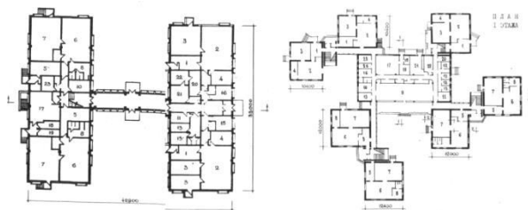
Figura 1. Grădinițe de tip bloc, pavilioane

Școlile se deosebesc printr-o capacitate mai mare de asigurare a elevilor și suprafața acestora depinde de treptele de învățământ îmbinate.