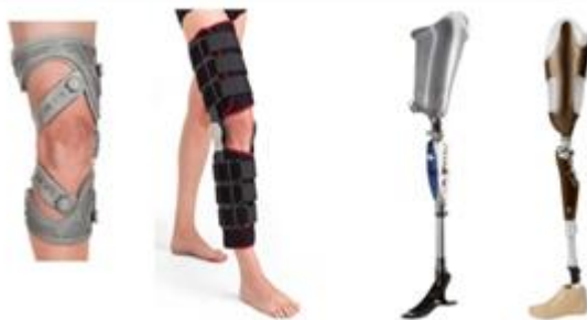
Figura 4: Orteză și proteză pentru membrele inferioare [10]

Persoanele cu dizabilități fizice au dificultăți în efectuarea unor tipuri de mișcări (deplasare, coordonare, precizie, postură); aceste persoane nu pot executa mișcări complexe, repetitive și cu amplitudine mare[5].