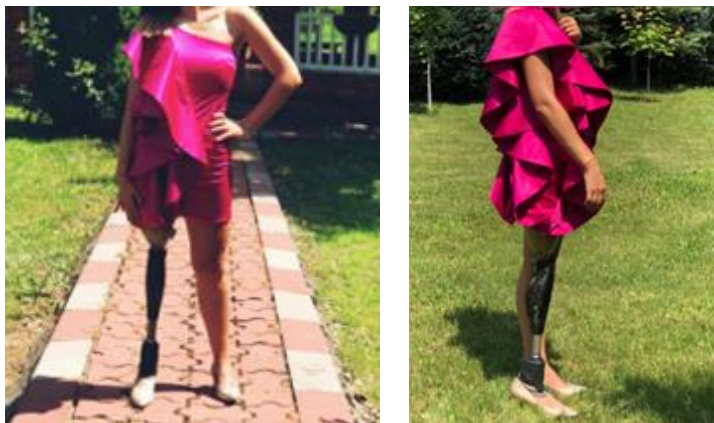
Figura 8: Prototip fizic model 1

"Îmi dă o stare bună întrucât întrunește toate condițiile. Nu aş schimba nimic. Ideea de volane mi-a plăcut cel mai mult, la fel cum mi-a plăcut și ideea de umăr gol. Lungimea este perfectă și scoate în evidență auriul frumos al cupei protezei."