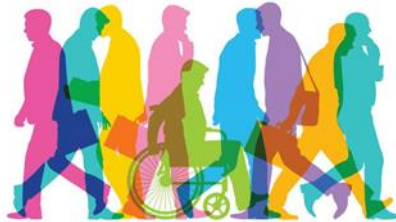
Figura 2: Integrarea în societate a persoanelor cu dizabilități [8]

Proiectarea și realizarea produselor de îmbrăcăminte se află sub incidența unor factori, ca de exemplu: vârstă, anotimp sau sezon, poziția socială, educația, stilul sau genul preferat. Concordanța dintre vestimentație și personalitatea purtătorului este foarte importantă și îi asigură acestuia confortul psiho-senzorial necesar. Poate că, în ciuda a milioane de potențiali clienți din întreaga lume, brandurile renumite în domeniul modei și-au îndreptat atenția către o piață de clienți specială, persoane cu dizabilități, care au nevoi și cerințe deosebite. Pentru producători, aceasta este o piață de nișă, care aduce noi provocări atât în partea de creație, cât și în partea de fabricație [7].