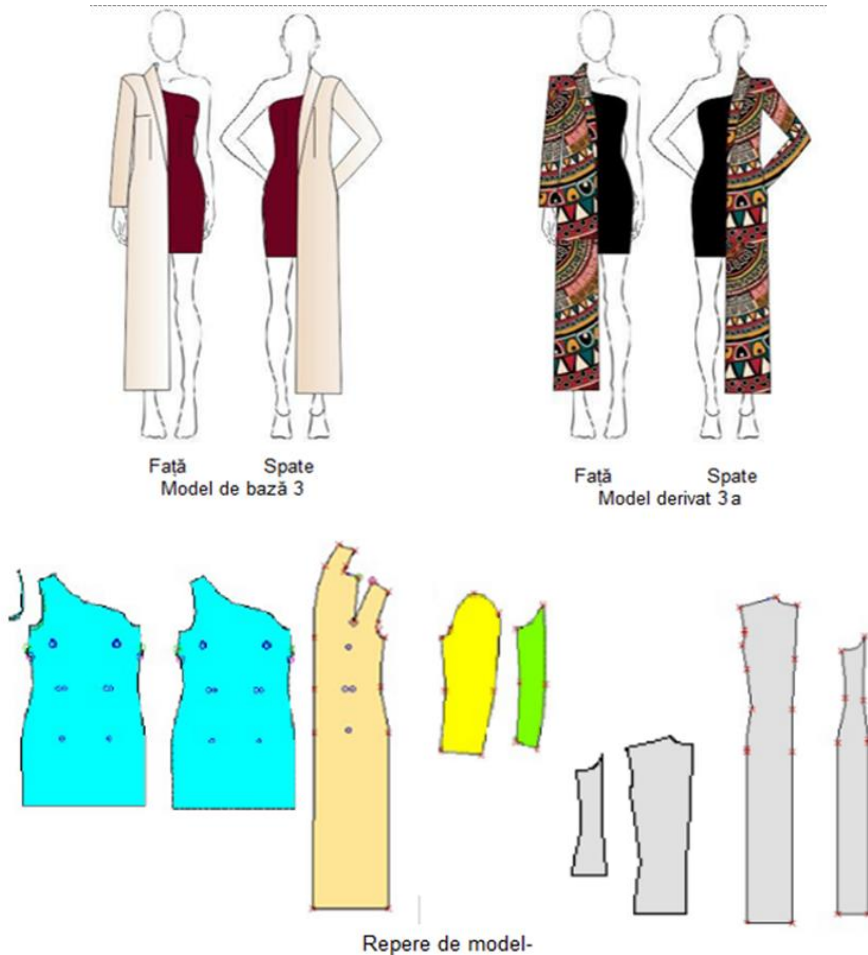
Figura 7: Model 3 – Complex - model de bază și modele obținute prin diversificare cromatică