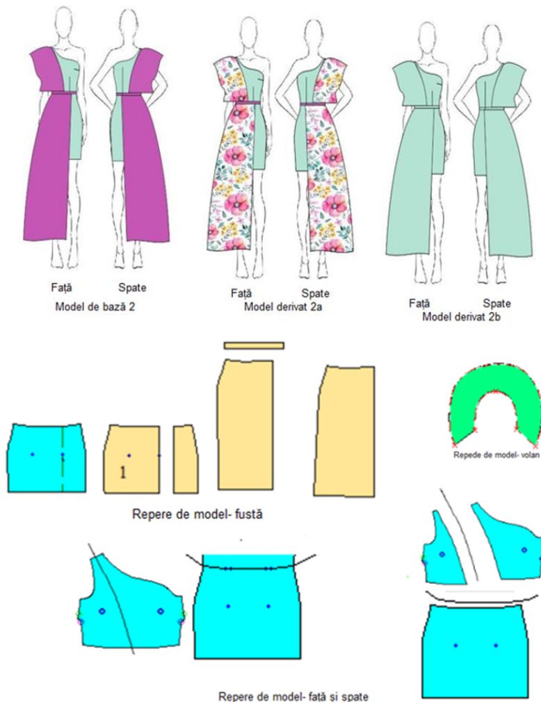
Figura 6: Model 2 (model de bază și modele obținute prin diversificare cromatică; repere de model)

Produsul prezentat poate fi confecționat din materiale uni, sau cu imprimeuri, perfect echilibrat din punct de vedere cromatic, pentru a scoate în evidență geometria și modul de poziționare a volanului și a fustei.