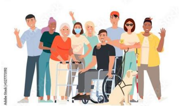
Figura 3: Persoane cu dizabilități la locul de muncă [9]

Tipul și severitatea dizabilității pot afecta gradul în care persoanele în care aceste persoane pot fi integrate în piața muncii. În acest moment, angajatorii asigură accesul persoanelor cu dizabilități la piața muncii, în corelație cu nivelul de dizabilitate și pregătirea lor profesională, dar oferta de locuri de muncă nu este foarte variată [3].