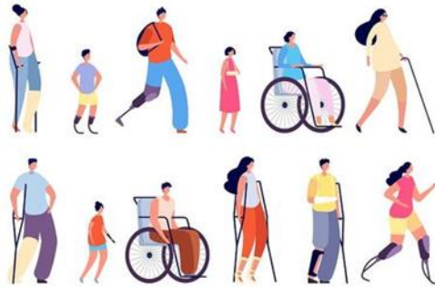
Figura 1: Persoane cu dizabilități locomotorii [8]

Proiectarea și realizarea produselor de îmbrăcăminte se află sub incidența unor factori, ca de exemplu: vârstă, anotimp sau sezon, poziția socială, educația, stilul sau genul preferat. Concordanța dintre vestimentație și personalitatea purtătorului este foarte importantă și îi asigură acestuia confortul psiho-senzorial necesar. Poate că, în ciuda a milioane de potențiali clienți din întreaga lume, brandurile renumite în domeniul modei și-au îndreptat atenția către o piață de clienți specială, persoane cu dizabilități, care au nevoi și cerințe deosebite. Pentru producători, aceasta este o piață de nișă, care aduce noi provocări atât în partea de creație, cât și în partea de fabricație [7].