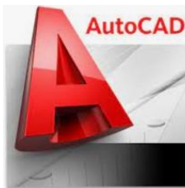
Figura 3: Soft-uri de specialitate