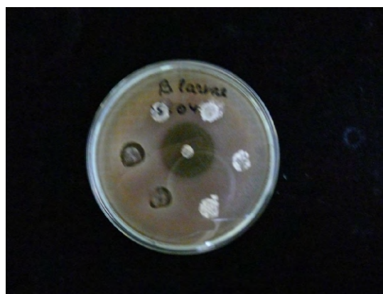
Figura 3. Zonele de inhibiție a patogenului Paenibacillus larvae : centru - neomicină, stânga - P. sp. 104

Conform rezultatelor prezentate, diametrul maxim de inhibiție a patogenului Paenibacillus larvae a fost înregistrat la tulpinile P. sp. 91 și P. sp. 110, constituind 20,3 ± 1,8 mm și, respectiv, 20,5 ± 2,31 mm.