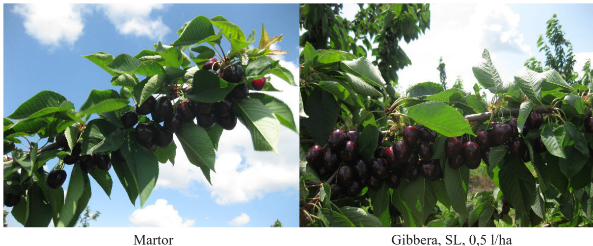
Figura 1. Gradul de legare și calitatea fructelor de cireș în coroana pomului din soiul Kordia în variantele experimentale

În continuarea cercetărilor s-a propus studierea randamentului și a greutateii medii a fructelor, deoarece există păreri în literatura de specialitate conform cărora, dacă pomii sunt tratați cu un regulator de creștere al cărui ingredient activ este acidul giberelic ( GA_{4+7} ), dezvoltarea fructelor este blocată, producția în cadrul unui pom și la o unitate de suprafață se reduce și poate avea o influență negativă asupra diferențierii mugurilor de rod pentru anul viitor, adică se instalează premise pentru o înflorire mai slabă. Alte studii arată rezultate care contrazic aceste păreri.