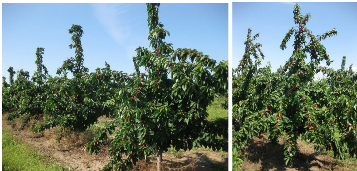
Figura 3. Productivitatea plantațiilor de cireș din soiul Kordia în rezultatul tratării cu regulatorul de creștere Gibbera, SL în doza de 0,5 l/ha

În varianta tratată cu regulatorul de creștere Gibbera, SL în doza de 0,5 l/ha s-a înregistrat o ușoară scădere a greutății medii a fructelor în comparație cu celelalte variante, dar numărul mai mare de fructe a dus la o creștere semnificativă a producției per pom (17,6 kg) și per unitate de suprafață (11,7 t/ha) (Fig. 3).