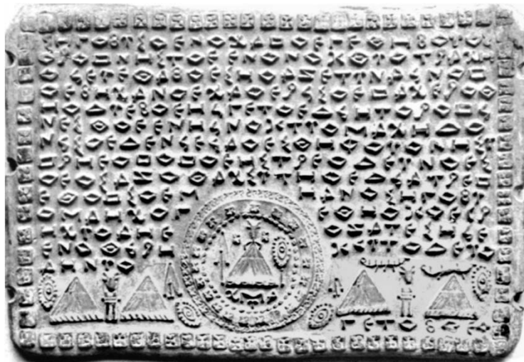
Fig. 5. Tăblița 109. Războinicii geți din nord-estul Traciei.

Conținutul tăbliței 109 (figura 5), după separarea în cuvinte și transcrierea textului cu caractere latine, este dat mai jos: Sigoby so eno hat oe gheti boyo so Ro to nistoe eno nohtyo Trahio ioe ye. Ta boe sio a ze tyn a Iono to evih ano chao erio tahe Ro. Tio dye boeiio gheto edioi to Ro tio nestoe e niio nohtyo Mahidonio soe de nio eio ao esti fo yon Isytrieo to. Toe Istreo dey noeso eos azot ah sy tio edio at Re te