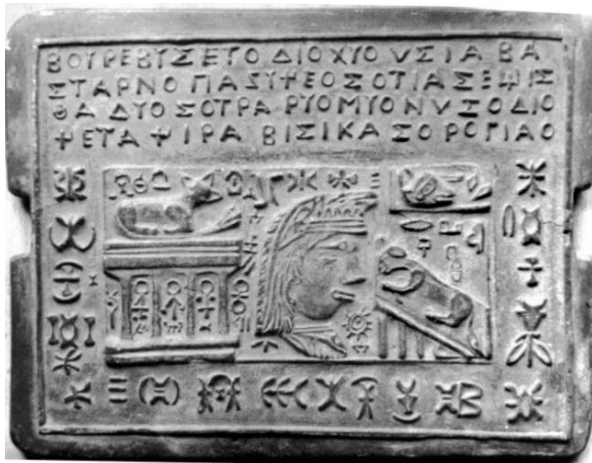
Fig. 2. Tablita 20. Bastarnii adoptă zeii geților în timpul lui Burebista.

Boyrebyseto dio hyo usia bastarno pazy ceo, so tia Segista dyoso, tra ryomyonuso dio ceta, cira bisika so Ro ghiao. În traducere: Burebista, zeii caruia poarta bastarnilor