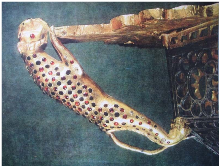
Fig. 6. Imagine a unui leopard pe vasul octogonal de la Petroasele.

între vederile vasului octogonal de la Petroasele și imaginea unui leopard, care mai trăiește astăzi prin munții din Asia Centrală, nu putem să nu observăm asemănarea izbitoare (figura 6).