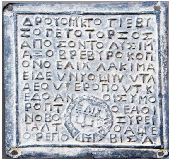
Fig. 3. Tăblița 23. Dromihete dă un ajutor norocos locuitorilor de la Elia Carseoy.

Prin traducere se obține următorul text: Dromihete cu ai lui din râpă geți de la cotul apei, la ai lui Lisimah devotați lui Ro de la templul Elih norocos ajutor (au dat), când o femeie de-a lor, care-și mulgea al ei uger, a strigat pe drumul