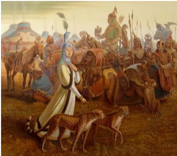
Fig. 7. Imagine a lui Batu-han cu leoparzi în suita sa.

important în istoria Europei. Autorii antici care au susținut că goții și geții reprezintă același popor nu au făcut, practic, nici o greșală. Singura deosebire ar putea fi faptul că geții din Moldova nu au suferit nici o influență din partea romanilor, în timp ce, cei rămași în teritoriul ocupat au suferit, inevitabil, unele influențe.