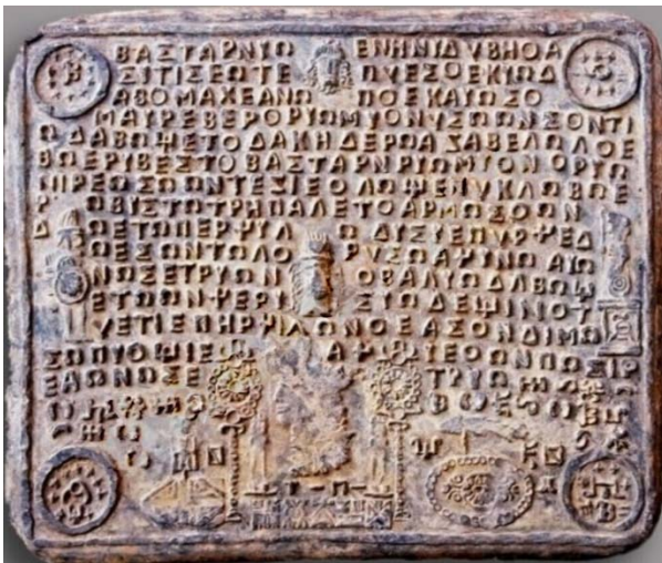
Fig. 1. Tăblița 126. Hotărârea lui Burebista referitoare la bastarni.

însuși, în tăblița cu numărul 126 (figura 1), conform numerotației utilizate în cartea lui Romalo [1]. Poate părea incredibil, însă această tăbliță este cu claritate opera lui Burebista, deoarece conține o hotărâre, prin care li se conferă bastarnilor dreptul de a locui în partea de sud a Dobrogei, în zona localității Marchianopol. Este posibil ca această hotărâre să fi constituit unul din motivele nemulțumirilor, care au dus la